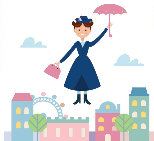
Мэри Поппинс для особенных детей

Родителям предоставляется свободное время для решения социальных, бытовых проблем семьи.