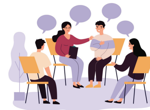
Добро начинается с детства

Обучающие модули подбираются исходя из запросов родителей, специфики заболеваний детей.