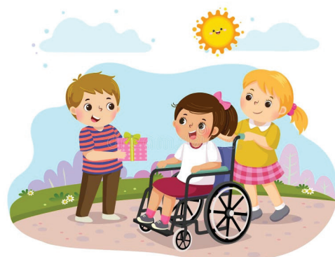
Особенным детям – особый праздник

Организованы поздравительные программы на дому для детей-инвалидов, выездные мастер-классы, мастер-классы по рисованию, крио и поролоновое шоу, площадки аквагрима, анимационные программы и адресное вручение подарков.