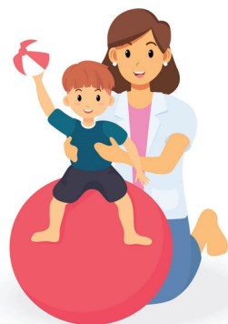
Реабилитация в привычных условиях

Проект позволил создать для детей-инвалидов реабилитационное пространство на дому, вовлечь родителей и ближайшее окружение семьи в коррекционно-развивающий процесс.