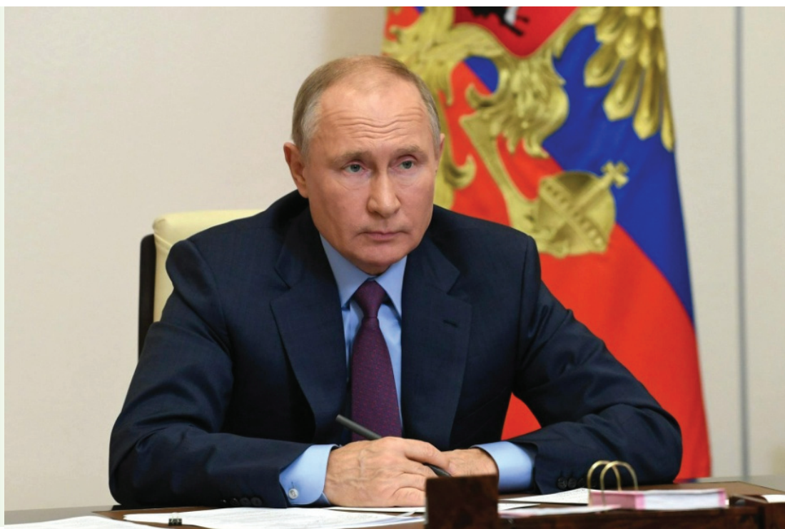
В.В. Путин Президент Российской Федерации

«Главное предназначение семьи – это рождение детей, продолжение рода, а значит, продолжение нашего народа, нашей многовековой истории. В семье укоренены наша культура, идентичность, национальный характер. Семья учит, воспитывает, передает традиции, знания, в том числе и профессиональный опыт.