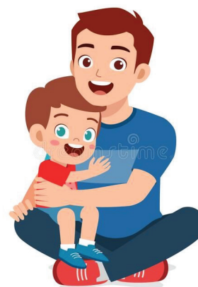
Папа может все что угодно

В обучении раскрываются права и обязанности отцов, особенности развития и реабилитации ребенка. А после все это вытекает в культурно-досуговые мероприятия: мастер-классы папы и ребенка, выездные мероприятия, совместные развивающие игры и т.д.